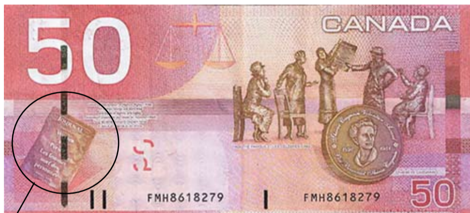
Вот тот самый документ, доказывающий права канадских женщин

потому что женщина! Подсудное дело! Но нет, со стен не исчезают феминистские плакаты. И даже на купюре в пятьдесят канадских долларов нарисована женщина, подписывающая бумагу, на которой крупными буквами выведено: «Женщины — тоже люди» (Women are persons too).